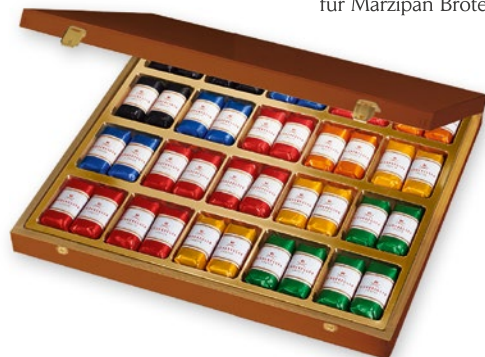
Präsentkiste mit Gravur