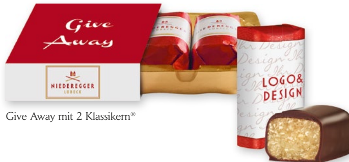
Give Away mit 2 Klassikern®