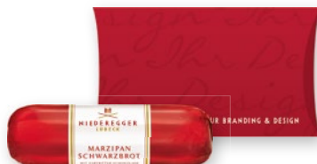
Kissen-Packung für Marzipan Brote