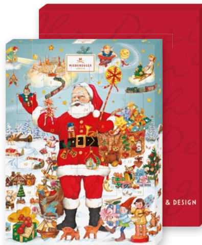
Adventskalender, 500g frei gestaltbar