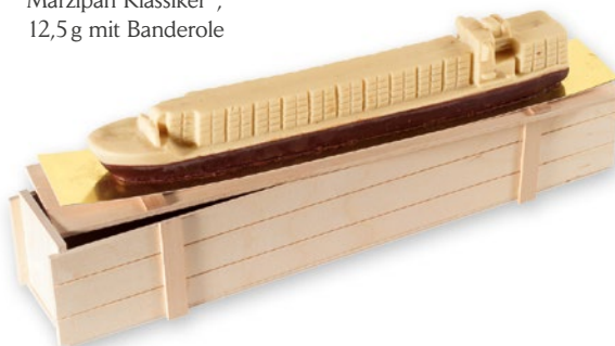
Marzipan Kunst, 3-D Modell nach Ihren Vorgaben