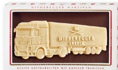
Marzipan Platte, 250g mit individuellem Marzipan Aufleger