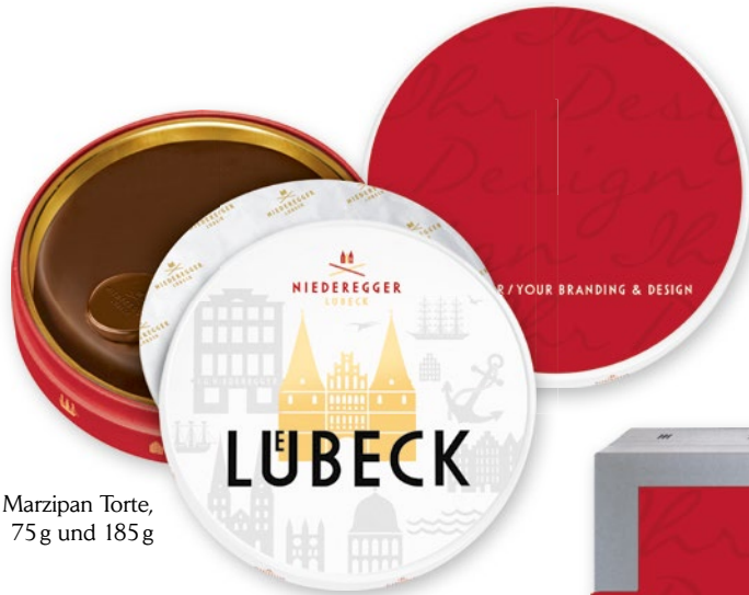
Marzipan Torte, 75g und 185g

Ob rund oder eckig, mit den Niederegger Dosen haben Sie für jeden Anlass das passende Geschenk.