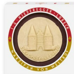
Marzipan Torte mit individuellem Aufleger aus Marzipan