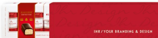
Marzipan Klassiker®, im 100g Schubert