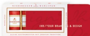
4 Marzipan Klassiker® mit Einleger