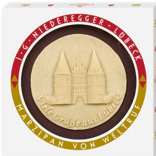
Marzipan Torte, 250g mit individuellem Marzipan Aufleger

Von Meisterhand aus feinem Marzipan gefertigt: Taler, Torten und Platten mit individuellem Aufleger (Logo, Motto, Motiv).