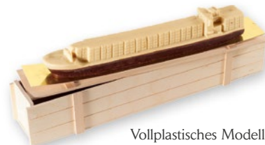
Vollplastisches Modell nach Ihren Wünschen