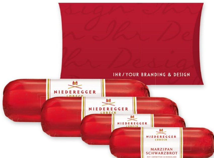
Marzipan Brote, von 48g–200g

Für jede Zielgruppe ein passendes Angebot.