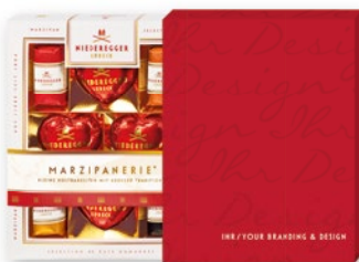
Marzipanerie, 100g mit Schubert