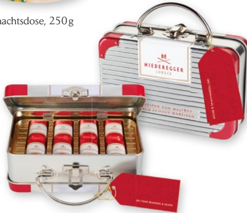
Reisekoffer mit 16 Klassikern®, 200g