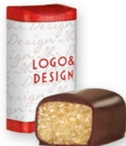
Marzipan Klassiker®, 12,5g mit Banderole