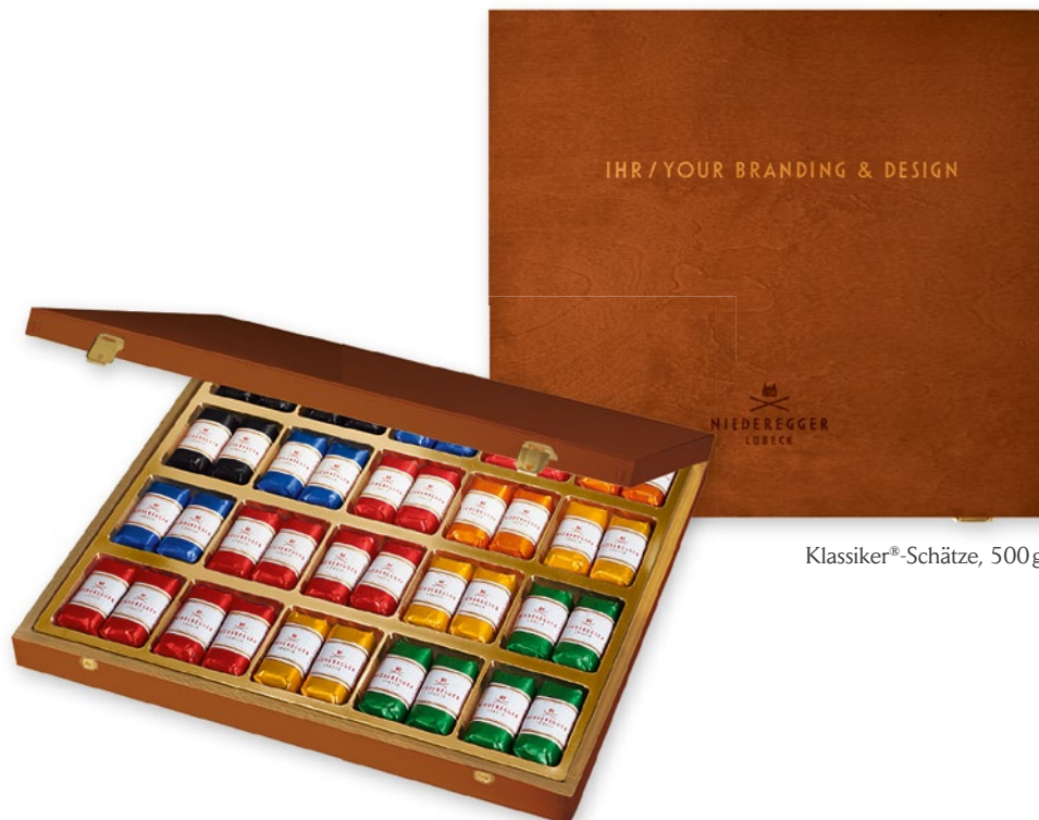
Klassiker®-Schätze, 500 g

Lassen Sie Ihren Geschäftspartnern oder Mitarbeitern einen persönlichen Dank mit einer individuellen Botschaft zukommen.