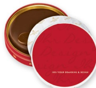
Marzipan Torte in der Dose, 75g und 185g