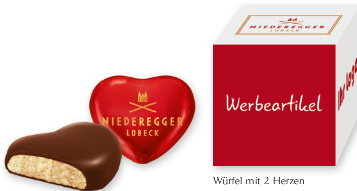
Würfel mit 2 Herzen

So hinterlassen Sie mit jedem Werbegeschenk einen geschmackvollen Eindruck.